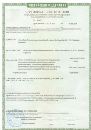
Бланк сертификата соответствия при обязательной сертификации