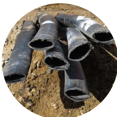
Потеря эксплуатационных характеристик