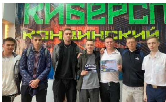
Молодежное пространство «Инициативный проект «Твоя территория»