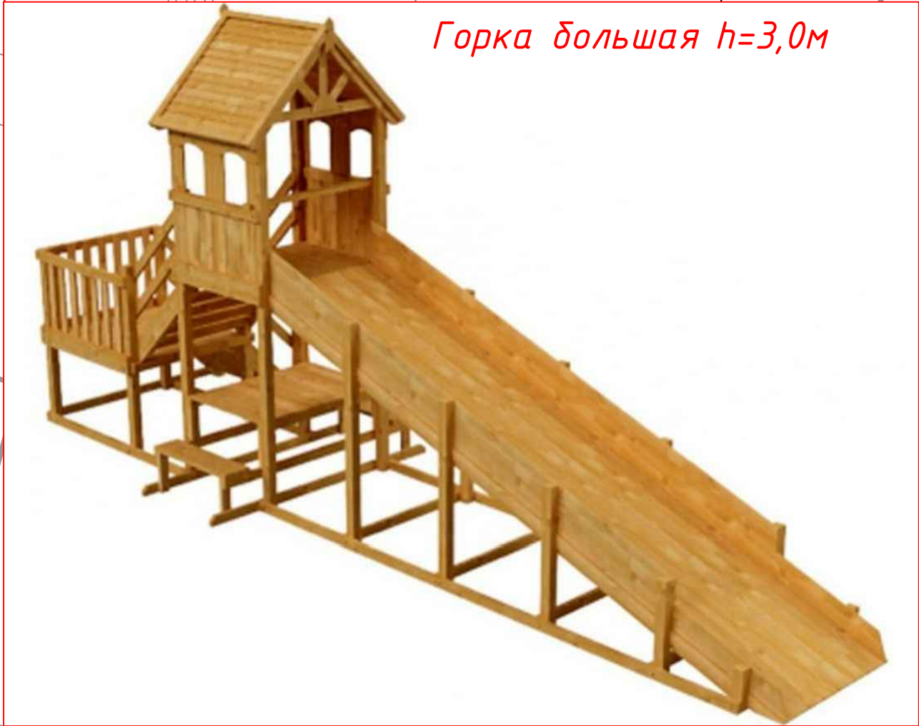
Горка большая h=3,0\text{м}