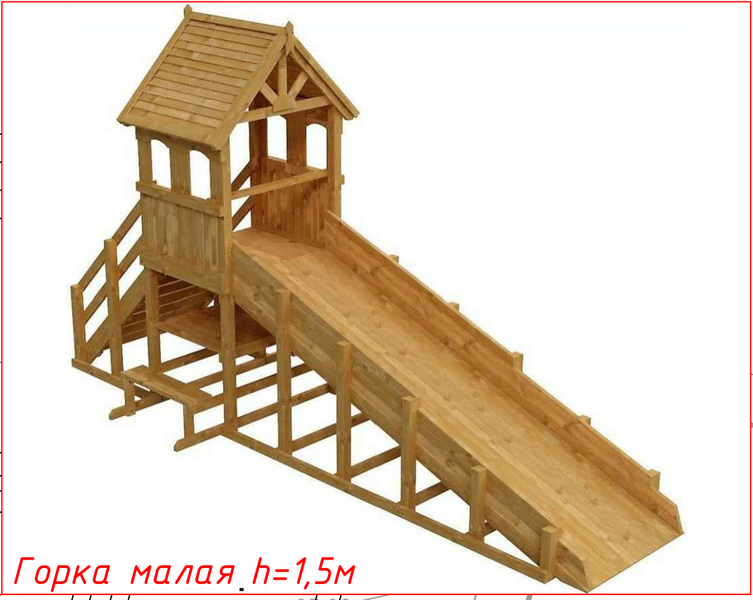
Горка малая h=1,5\text{м}