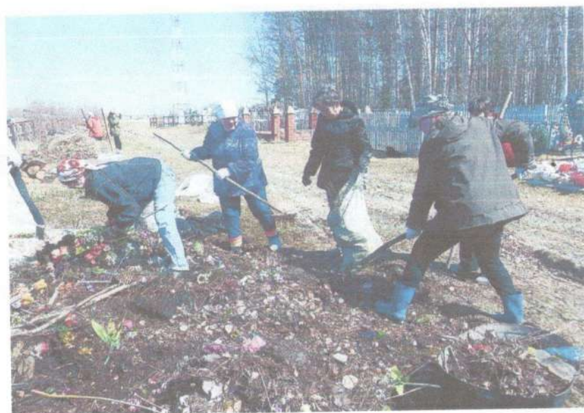
Проведение субботников с участием местных жителей